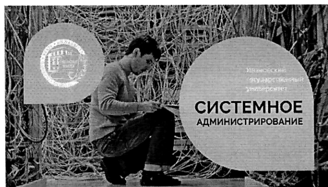
Системное администрирование (262 ч.)