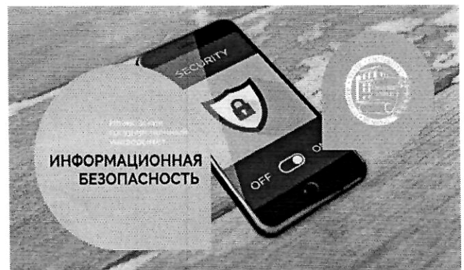
Информационная безопасность (512 ч.)