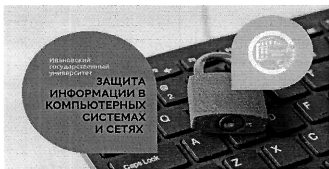
Защита информации в компьютерных системах и сетях (270 ч.)

Подробнее познакомиться с программами и подать заявку на обучение можно на сайте https://dp.ivanovo.ac.ru/ .